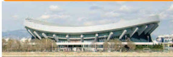
Στάδιο Ειρήνης & Φιλίας